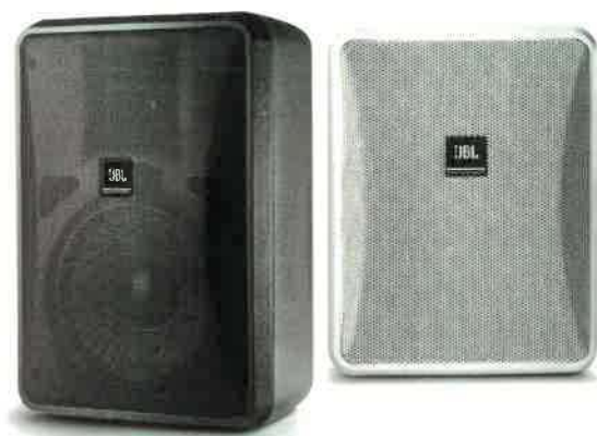
Obrázek 6 - reproduktory na nástěnném držáku – v půdoryse reproduktory 1 - 4

Dvoupásmová reproduktory min. 8"+3/4", pokrytí min. 90°x90° max. 110°x110°, výkon min. 200W / 8 Ω, citlivost min. 90 dB, frekvenční rozsah min. 50Hz – 20kHz, rozměry max. výška 400 x šířka 300 x hloubka 230 mm, polohovatelný držák na zeď, bílé nebo černé provedení.