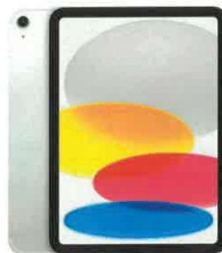
Obrázek 11 - tablet pro ovládání