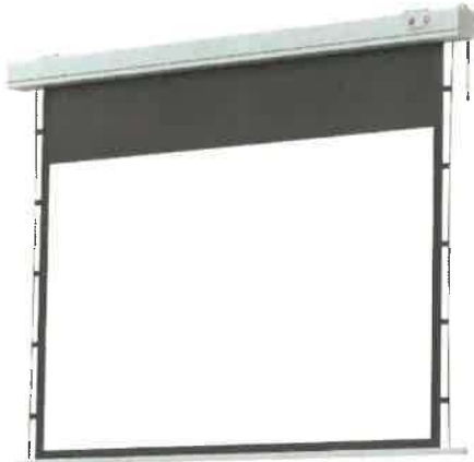
Obrázek 4 – elektrické projekční plátno – umístění nad pódiem

Elektrické projekční plátno šíře 300 cm v poměru stran 16“9. Zavěšené v prostoru pódiu na stropě nad pódiem.