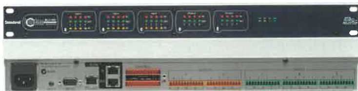
Obrázek 8 - audio DSP mixážní matice

Audio signály budou zpracovány a mixovány v DSP mixážní matici s min. parametry: Mixážní matice s digitálním signálovým processingem, min. parametry: 12 symetrických vstupů / 8 symetrických výstupů, min. 4 logické vstupy/výstupy, digitální sběrnice s min. 32 zvukovými kanály, indikační LED, ethernet pro nastavení, kontrolu a monitoring, vstup pro řízení.