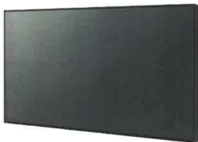
Obrázek 3 – LCD displej 86" – v půdoryse displej 1 a displej 2

Dva postranní LCD monitory s úhlopříčkou 86", rozlišení 3840 x 2160, jas min. 500cd/m 2 , haze úprava min. 25%, odezva max. 8ms, provoz 24/7, vstupy HDMI, DP in, RS232C, RJ45, USB-C/USB, SDM slot, včetně nástěnných držáků a možností náklonu a přijímači signálu HDBase-T po kabelu CATx s funkcí převodu do min. HDMI 1.4a. Budou sloužit jako náhledy pro diváky i přednášejícího.