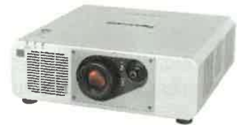
Obrázek 5 - projektor pro doplňující projekci – v půdoryse projektor 5

Pro možnost klasické přednášky (prezentace) – přípojně místo HDMI s extenderem – vysílačem HDMI na HDBase-T po CATx kabelu umístěné v prostoru pódiu. Převodník podporující min. HDMI 1.4a s podporou 4K/UHD@60Hz 4:2:0.