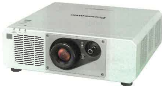
Obrázek 2 - Projektory na kouli – v půdoryse projektory 1 - 4

Projekční poměr musí zahrnovat hodnotu 2,8:1.