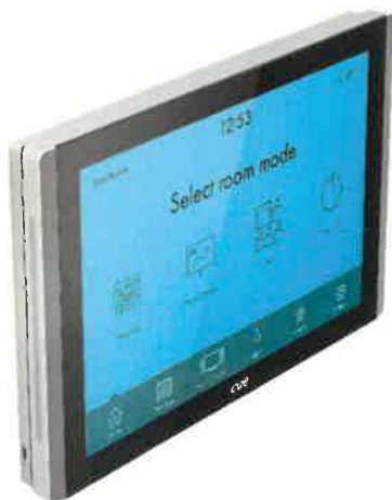
Obrázek 10 - panel řídicího systému

Součástí systému řízení bude kontrolér ovládající koncová zařízení AV techniky (projektory, LCD displej, ozvučení, výtah koule). Pro možnost ovládání odkudkoliv bude k dispozici tablet, který bude primárně sloužit pro ovládání SoS, ale bude z něj možné systém SoS vypnout a zapnout.