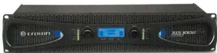
Obrázek 9 - audio zesilovač

K reproduktorům budou signály z mixážní matice vedeny přes dva výkonové audio zesilovače s min. parametry: min 2x_200W / 8Ω a DSP procesor – nastavení EQ, propustí, možnost nastavení vstupních úrovní 1,4Vrms a 0,775Vrms, limiter, LCD panel, LED indikace stavu, XLR a jack vstupy, preamp. výstupy, kontakty pro sleep mode, spínaný zesilovač a zdroj, společná výška max. 2U.