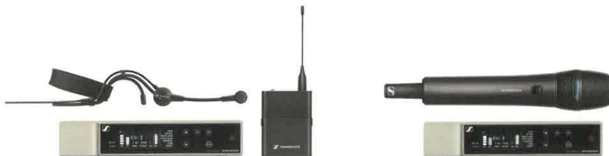
Obrázek 7 - bezdrátové mikrofony

Dále bude v systému ozvučení zařazen eliminátor zpětné vazby pro účinné potlačení rušivé zpětné vazby mezi mikrofony a reproduktory.